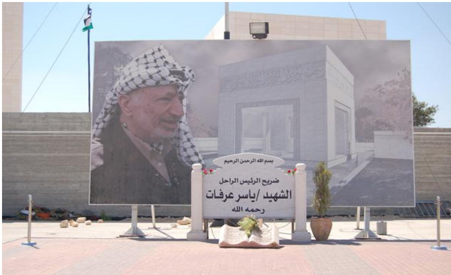
Yaser Arafat'ın Kabri

Ekim ayının sonlarında rahatsızlanan Filistin lideri Yaser Arafat, 11 Kasım'da tedavi için götürüldüğü Fransa'da hayatını kaybetti. Mahmud Abbas, Filistin Kurtuluş Örgütü liderliğine getirildi.