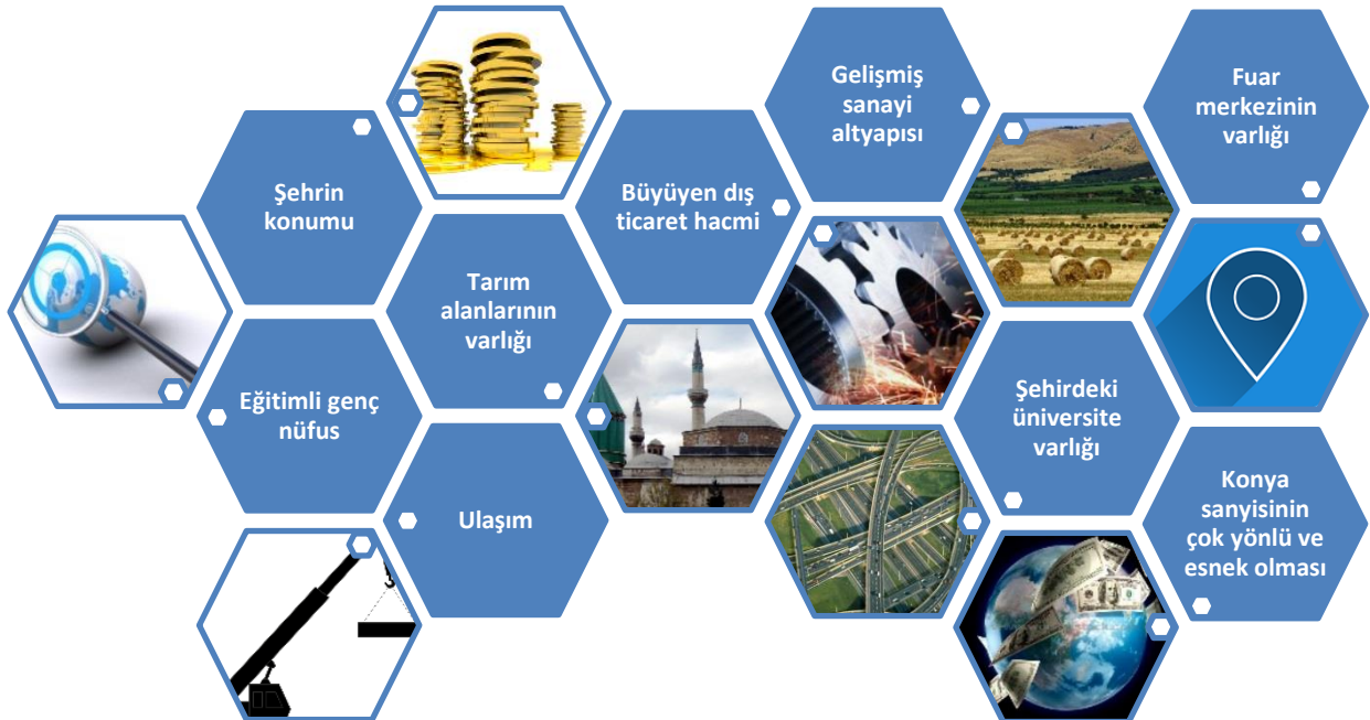
Şekil 1: Konya’da Yatırım Ortamını Çekici Kılan Unsurlar

Yabancı yatırımcının Konya’yı tercih etme sebepleri; lojistikten yatırım yerine, pazar erişim kolaylığından beşerî özelliklere kadar birçok neden sayılabilmektedir.