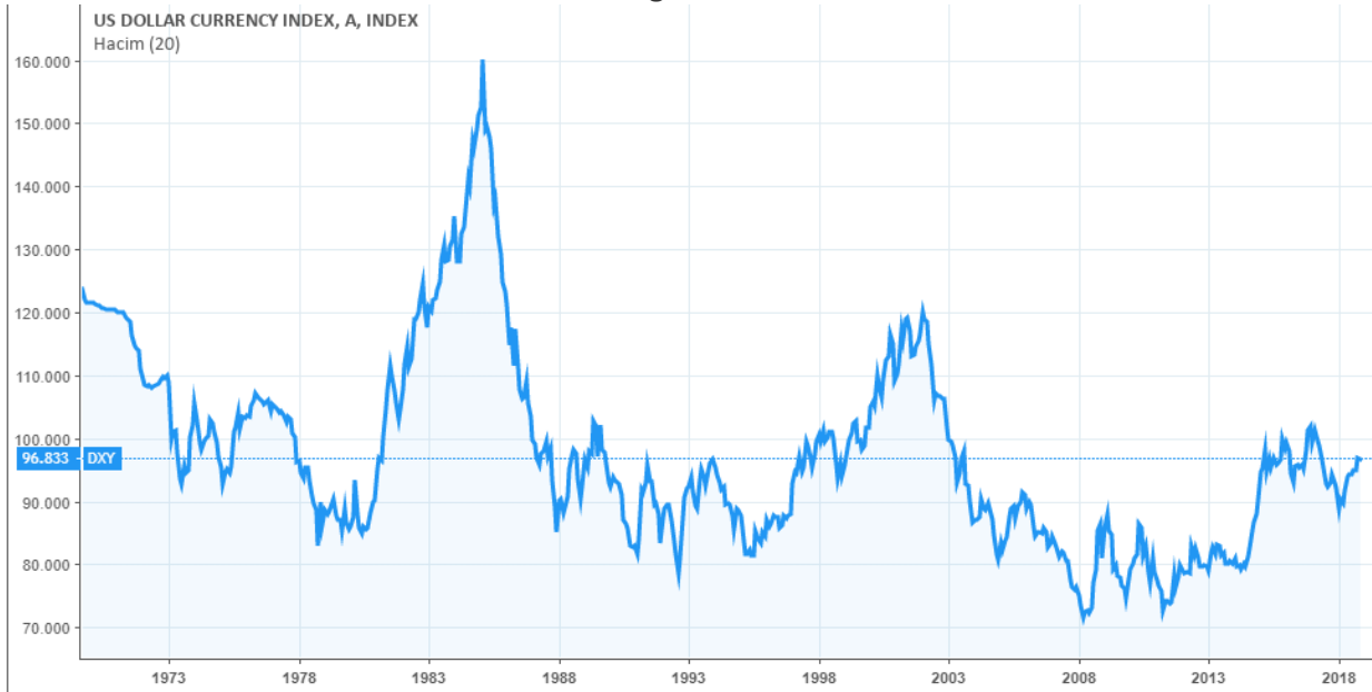
Grafik 2: Tüm Zamanlara Ait Dolar Endeksi Grafiği