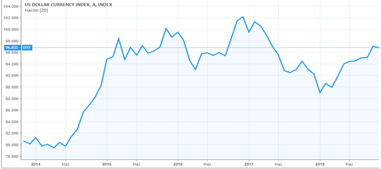
Grafik 3: 2014-2018 Dolar Endeksi Grafiği

Kaynak: TradingView, Erişim Tarihi: 29 Kasım 2018, DXY=96,833